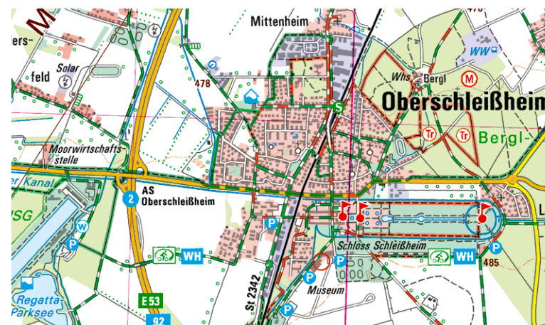
Ausschnitt aus UK50-40 München Nord und West

Und das Schöne: One-Way-Touren sind im Großraum München dank des hervorragenden Netzes des Münchner Verkehrsverbundes auch kein Problem!